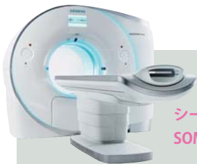
シーメンス社製 SOMATOM Force

2015年10月に導入された最新鋭のCTです。従来のCTよりも低線量化が実現可能になりました。新CT導入により冠動脈の動脈硬化病変に沈着する石灰化の程度（強さや体積など）を評価する「冠動脈石灰化スコア検査」が新たに加わりました。 ※循環器OPを実施する方が対象です。 ※負荷心電図検査は中止となりました。