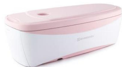
島津製作所製 Elmammo(エルマンモ)